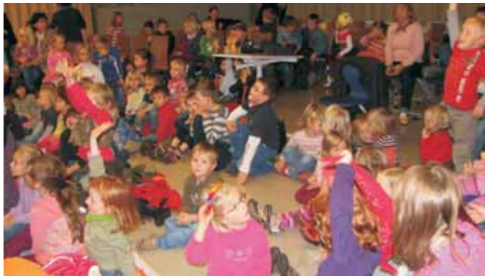
Begeistert haben die Kinder sich beim Fredericktag eingebracht.

Der diesjährige Fredericktag am vergangenen Dienstag war wieder einmal ein voller Erfolg. Mit Begeisterung nahmen viele kleine und große Leser am Lesezeichenbasteln mit der Schulsozialarbeit sowie am Bücherflohmarkt, dem Frederickquiz und der Autorenlesung mit Sigrid Zaevert teil. Dafür möchte das Büchereiteam allen, die zum Gelingen dieses Tages beigetragen haben, recht herzlich danken!