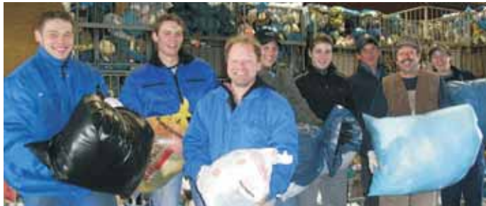
Sammelteam der Kolpingsfamilie beim Abladen in der Firma Striebl in Langenenslingen