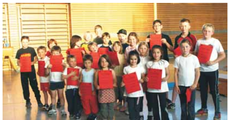
Gruppenfoto der Einzelwettkämpfe

Ein herzliches Dankeschön gilt den ehrenamtlichen Helfern aller Abteilungen und den vielen Kuchenspendern, die zum Gelingen dieser Veranstaltung beigetragen haben.