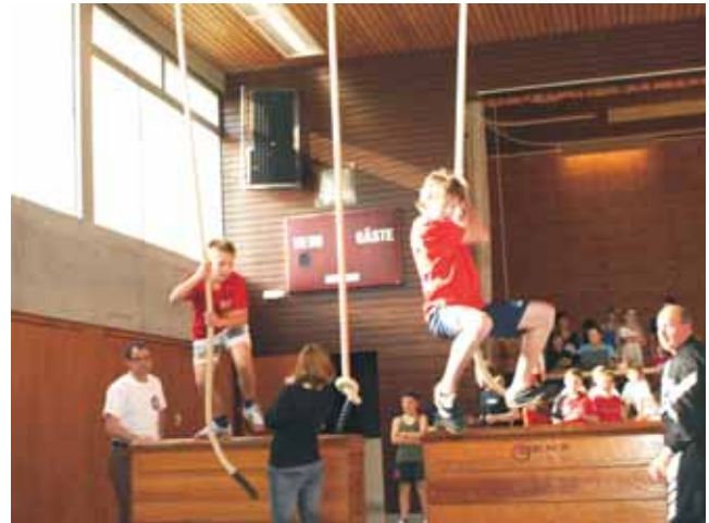
Krafteinsatz beim Schwingen