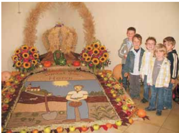
Kindergartenkinder bestaunen den Ernteteppich, auf dem der Bauer auf dem Feld das 11.00 Uhr-Gebet betet.